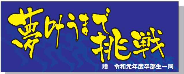
120cm巾×300cm 上下段:手書き風