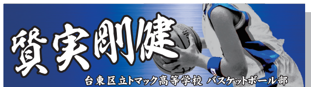
140cm巾×500cm 上段:太行書/下段:楷書