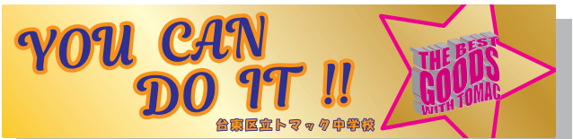
120cm巾×500cm 上下段:Magnolia Script