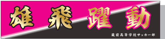
90cm巾×300cm 上段:太楷書/下段:楷書