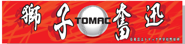
140cm巾×600cm 上段:花神(アレンジ)/下段:楷書